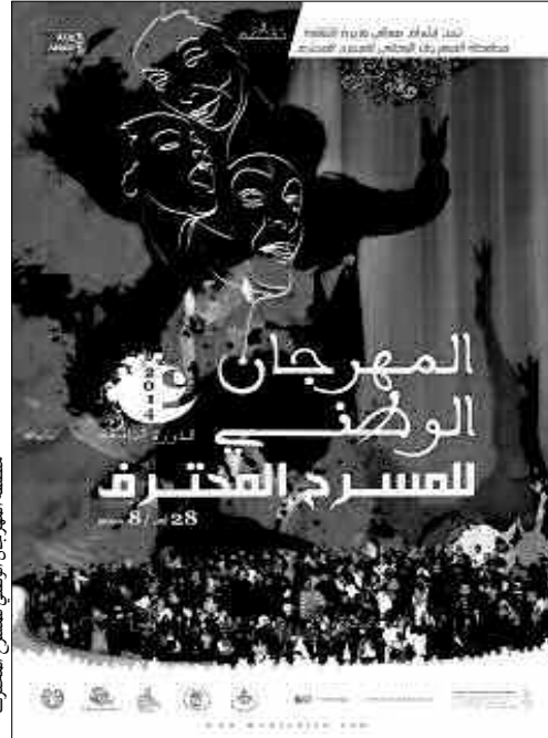
ملاحظة: المهرجان الوطني للمسرح المخترف