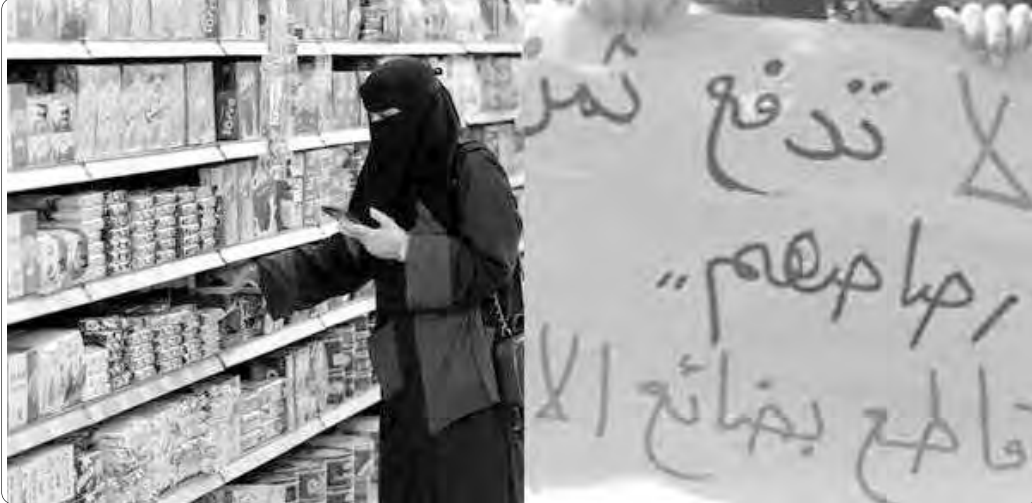
المقاطعة سياسة محجرة للشعوب

تواصل العديد من العائلات الجزائرية، مقاطعتها لعدد من السلع والمنتجات من علامات تجارية أجنبية مدعومة للكيان الصهيوني، وجاءت هذه المقاطعة امتدادا للمقاطعة العالمية، التي دعت إليها مختلف الشعوب المؤيدة للقضية الفلسطينية، دعما لشعبها، خاصة لسكان قطاع غزة، الواقع تحت وحشية وإرهاب جيش الاحتلال الصهيوني، منذ حرب السابغ أكتوبر الماضي، حيث تهدف المقاطعة، حسب مؤيديها، إلى الإضرار بمختلف العلامات والقطاعات التي تد بيد العون لهذا المحتل الفاسد، ومحاولة التأثير على القوى الخارجية التي تزدها قوة ومطغيانا ضد الأبرياء، حيث تعود عائدات أرباحها إلى هذا الكيان الظالم. ولعرفة مدى تبني هذا السلوك، كان لـ"المساء"، جولة استطلاعية بين عدد من المحلات، للتقرب من الزبائن والتجار، كما كان لها حديث مع بعض الخبراء، لمعرفة الأثر الحقيقي للمقاطعة التي ينتهجها المواطن. نور الهدى بوطيبة