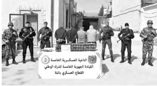
التاج العسكرية الخاصة القيادة الجوية الخاصة للدرك الوطني القطاع العسكري بآنية

المغرب، فيما تم ضبط 135 غرام من مادة الكوكايين و98681 قرص مهلوس. وأضافت الحصيلة ذاتها، أن مفارز للجيش الوطني الشعبي أوقفت بكل من تمنراست، برج باجي مختار، إن قزام وتودوف، 317 شخص وضبطت 33 مركبة، 132 مولد كهربائي، 99 مطرقة ضغط و6 أجهزة للكشف عن المعادن، بالإضافة إلى كميات من المتفجرات ومعدات تفجير وتجهيزات تستعمل في عمليات التفجير غير المشروع عن الذهب. كما تم توقيف 35 شخصا آخر وضبط 23