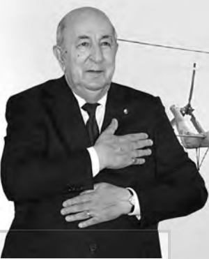
هنأهم التتويج بالبطولة ..

وأشار إلى أن الإحصاء العام للفلاحة هو عملية شاملة تشمل مختلف القطاعات الفلاحية، من الزراعة إلى الغابات، ومن الثروة الحيوانية إلى الثروة السمكية، وهو ما يتطلب تنسيقا وثيقا بين مختلف الجهات المعنية.