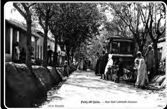
Ferijoua - Rue Sidi Lahtheti-Aitana