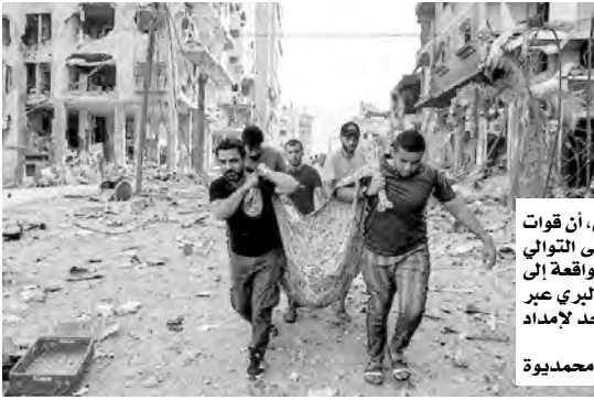
أكد رئيس بلدية رفح، أحمد الصوفي، أن قوات الاحتلال واصلت أمس ولليوم 12 على التوالي استهداف واجتياح شرق مدينة رفح الواقعة إلى أقصى جنوب القطاع، وغلق معبرها البري عبر الحدود مع مصر والذي يعد الشريان الوحيد لإمداد كامل القطاع بالمساعدات والمؤونة.