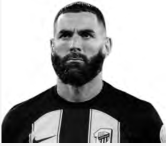
حسب شبكة "ريليفو" الإسبانية