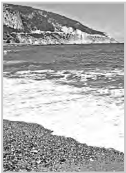
الحقب المتتالية من التاريخ..