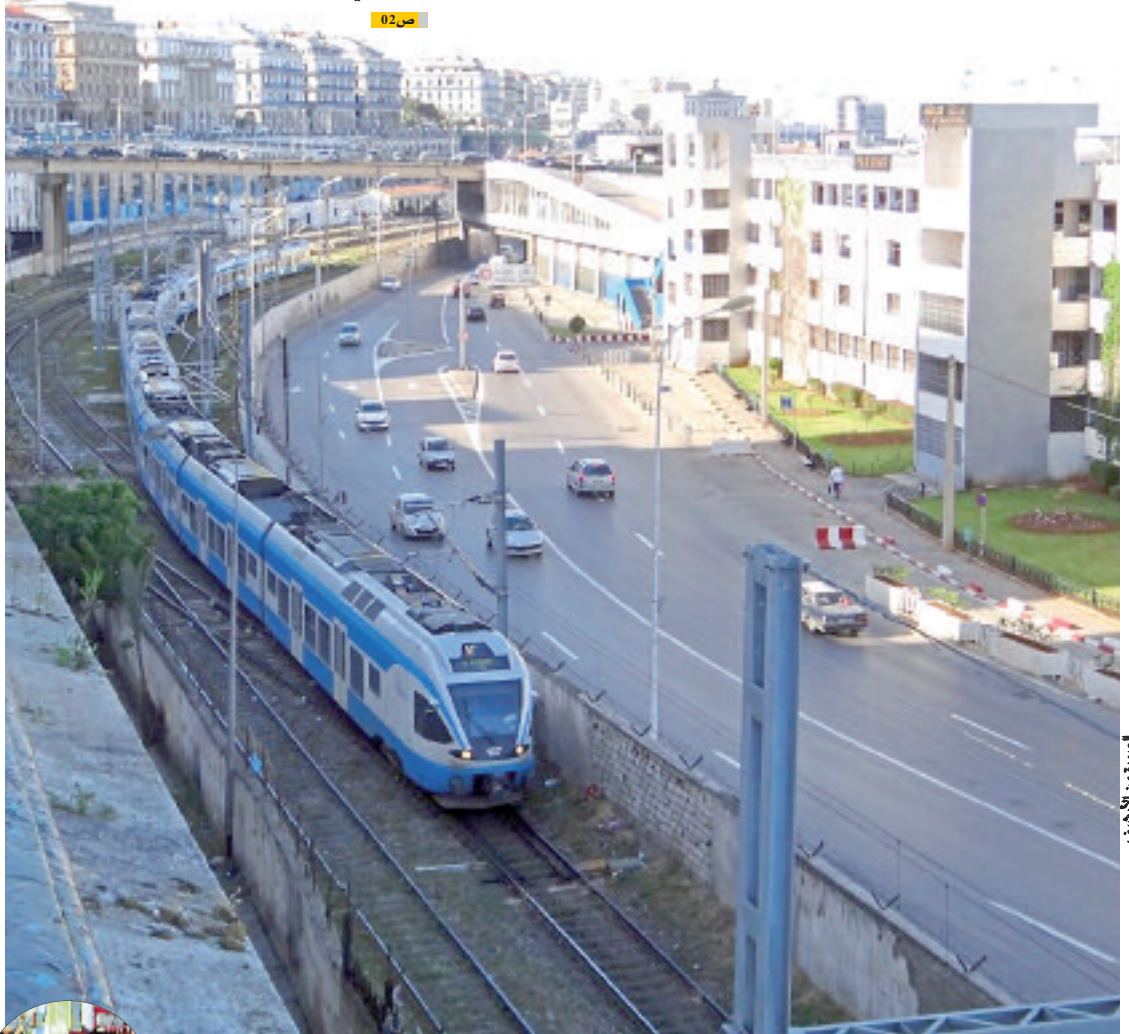
المسيرة من الأرياف