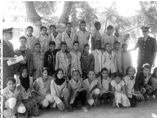
صورة للتلاميذ إحدى المدارس بغرداية مع إطارات الشرطة

سطرت مصالح بولاية غرداية، برنامجا تحسيسيا وتوعويا يخص الدخول المدرسي الذي يأتي في إطار تنفيذ المخطط الاتصالي لسنة 2014، والذي تشرف عليه المديرية بمناسبة حلول السنة الدراسية 2014 / 2015، حيث باشرت مصالح الأمن انطلاقا من هذا الأسبوع تنظيم زيارات ميدانية إلى المؤسسات التربوية بإشراف إطارات متخصصة في الأمن العمومي، تقوم بتجسيد حملة تحسيسية لفائدة التلاميذ المتمدرسين من خلال إلقاء الدرس التوعوي في السلامة المرورية، مع عرض السلوكات السليمة لذلك من خلال التركيز على النقاط التي تسهل عملية تحريك الأطفال في الشارع، و أثناء التوجه والعودة من المدرسة. • ق.م