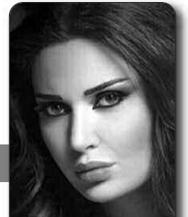
سيرين عبد النور تعيش «سيرة الحب»