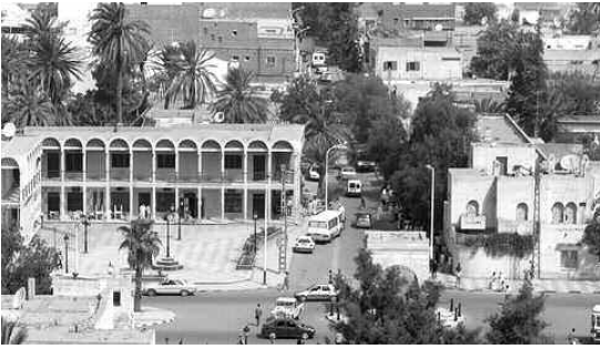
مدينة الأغواط (أرشيف)

لاسيما بلديتا الخنق وحاسي الدلاء: لكونهما تعانين من ندرة وملاوحة في نوعية المياه. ومن جانب آخر، تعززت الولاية بنحو 10 محطات لتبضيف المياه المستعملة، بعضها تم استلامه والبعض الآخر لايزال في طور الإنجاز. ويعتمد تقنيات جديدة، على غرار تقنية التهوية الطبيعية بمحطة تاجرونة، وكلها محطات تطابق والمعايير الصحية المطلوبة. وتشهد الولاية حاليا تزود حوالي سبع بلديات بالمياه الصالحة للشرب بطيلة اليوم، بينما تستفيد البلديات الـ 17 الأخرى من نفس المادة في أوقات محددة، ولفترات متفاوتة يوميا. للتذكير، فإن نسبة الموارد المائية المستغلة تمثل في 98 في المائة من الموارد الكلية بولاية الأغواط: إذ تعتمد في استغلال الموارد المائية لتزويد السكان بالمياه الصالحة للشرب ولسقي المانة بقدرات حشد للمياه تصل إلى 42 مليون متر مكعب سنويا في تجميعين ببلدية الجهة الجنوبية من الولاية بالمياه الصالحة للشرب، وفي سبياقي ذي صلة، تم ربط بلدية قصر الحيران بهذه المادة الحيوية انطلاقا من بلدية المسافية على مسافة تقارب 16 كلم، وهي العملية التي كلفت 258 مليون دج برسم المخطط الخماسي الحالي (2010-2014). ويراهن على سد سكلافة ببلدية وادي مزي، والذي بلغت نسبة تقدم الأشغال به حوالي 60 في المائة بقدرات حشد للمياه تصل إلى 42 مليون متر مكعب سنويا في تجميعين ببلدية الجهة الجنوبية من الولاية بالمياه الصالحة للشرب، للقطاع. (وا)