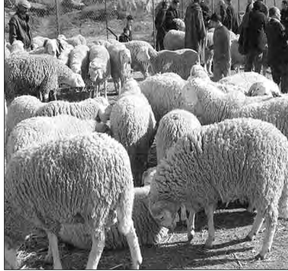
مستوى مؤسسة لاتراكو.