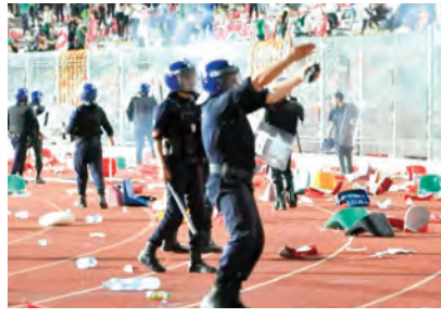
في ميانى ملوكة للدولة، التحريض والائلاف المؤدي للمسلسات

بالأمم والنظام العام المرتكب في إطار جماعة إجرامية منظمة، وجنح التحريض على التمييز والكرامية بالدعوة لعنف، إنشاء وإدارة والإشراف على حساب الإلكتروني مخصص لنشر معلومات لترويج أفكار من شأنها إثارة التمييز والكرامية التعدي بالعنف على رجال القوة العمومية أثناء تادية مهامهم مع سبق الإصرار والترصد وحمل أسلحة بيضاء". وأشار أنه بعد استجواب المتهمين من طرف قاضي التحقيق أصدر أوامر بإيداع الجميع رهن الحبس المؤقت.