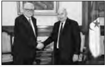
استقبل رئيس الجمهورية السيد عبد المجيد تبون أمس، بالجزائر العاصمة، عميد مسجد باريس الدكتور شمس الدين حفيظ، حسبما أروده بيان لرئاسة الجمهورية.