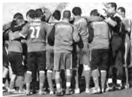
لتنفيذ طاقاتهم وموابعهم، خاصة ما تعلق منها بالتحفيز المالي اللازم.

كما أن باغور، غالبا ما كان يصرح بأنه يدين للفرق، ولولا لحيه الخاص، لما تمكن جمعية وهران من إنهاء مواسمها في قسمها، وما يدينه للفرق مقيد في تقارير الجمعيات العامة السابقة، وهو ما يعني تقديمه شروطا مقابل الرحيل، حتى في ظل ضغوط السلطات المحلية، وقد يطول هذا السجل، ما ينعكس سلبا على استعدادات جمعية وهران للموسم القادم، الذي لن يقل صعوبة على سابقه. وحسبما بلغ "المساء" من مصدر، على صلة بالأوضاع الداخلية، فإنهم سيواصلون ضغوطهم على كل من له صلة بلفظ، ومستقبل جمعية وهران، إلى غاية تحقيق مطالبهم، وتخليص جمعية وهران من مخالب الميسرين الحاليين، بحسبهم.