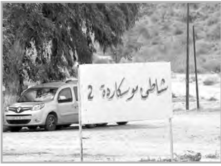
مرسى بن مهيدي الساحلية.

كما تراهن السلطات بولاية تلمسان خلال موسم الاصطياف، على توفير مساحات أرضية سياحية يطالبها السائح، لتحقيق خدمات نوعية ومتميزة، لفائدة السائح المحلي والأجنبي؛ حيث أعدت الولاية مخططات التهيئة السياحية الموجهة للسياحة الجبلية؛ من أجل تنمية القطاع، وتدارك النقص في المساحة السياحية، لاستقطاب أكبر عدد من السياح والمصطافين الذين يتوافدون على تلمسان من مختلف ولايات الوطن خاصة الداخلية منها، ومن خارج الوطن خاصة جالياتنا المقيمين بالخارج، الذين يجدون قضاء عطلة الصيف بالقرب من عائلاتهم.