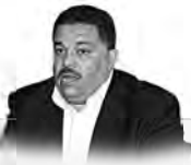
تجسيد حصيلته الواردة في تعهدهاته 541.. صوت الشعب،

دعا رئيس المجلس الأعلى للشباب، مصطفى حيدوي، الشباب إلى التسجيل بقوة في القوائم الانتخابية من أجل المساهمة في إنجاح الانتخابات الرئاسية المقررة يوم 7 سبتمبر المقبل. وأكد حيدوي، خلال كلمته في جلسة حوارية مع الشباب في إطار فعاليات الحملة التوعوية، أن المشاركة في الانتخابات هي واجب وطني، ويجب على الشباب أن يتحملوا مسؤوليتهم في اختيار من يمثلهم في المؤسسات الوطنية. وأشار حيدوي إلى أن التسجيل في القوائم الانتخابية هو الخطوة الأولى نحو المشاركة الفعالة في الحياة السياسية، ودعا الشباب إلى التوجه إلى مراكز التسجيل في أقرب وقت ممكن، وأن يكونوا على دراية بآليات التسجيل والاختيار. وختتم حيدوي حديثه بالتأكيد على أن المشاركة في الانتخابات هي فرصة للشباب للتعبير عن آرائهم ومطالبهم، ولتعزيز دورهم في التنمية الوطنية، ودعا جميع الشباب إلى المشاركة بفعالية في هذه العملية التاريخية.