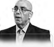
رئيس حركة مجتمع السلم

دعا حزب صوت الشعب، أمس، بالعمامة، رئيس الجمهورية، عبد المجيد تبون، لترشح لعهدة ثانية في الانتخابات الرئاسية المقررة في 7 سبتمبر القادم، من أجل دعم الاستقرار السياسي والاقتصادي والاجتماعي في البلاد. وأكد رئيس هذه التشكيلة السياسية، بين عصامي، في خطاب أمام دورة المجلس الوطني لجمعية حماية المستهلك، أن ترشح الرئيس تبون لعهدة ثانية هو الخيار الأفضل للبلاد، لأنه سيضمن استمرارية العمل الجاد والجدد، وسيحافظ على الاستقرار السياسي والاقتصادي، وسيتمكن من معالجة التحديات التي تواجهها الجزائر. وأشار عصامي إلى أن ترشح الرئيس تبون لعهدة ثانية هو خيار وطني، ويجب على جميع المواطنين أن يدعموه بقوة، وأن يكونوا على دراية بأهدافه وبرامجه. وختتم عصامي حديثه بالتأكيد على أن ترشح الرئيس تبون لعهدة ثانية هو الخيار الأفضل للبلاد، لأنه سيضمن استمرارية العمل الجاد والجدد، وسيحافظ على الاستقرار السياسي والاقتصادي، وسيتمكن من معالجة التحديات التي تواجهها الجزائر.