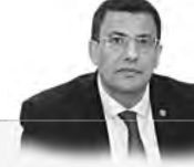
لواصله برنامجه الإصلاح الطموح

أكد رئيس حركة مجتمع السلم عبد العالي حساني شريف، أمس، أن حركة مجتمع السلم ستخوض الانتخابات بروح من التنافسية العالية، وأن جميع المرشحين سيخوضون الانتخابات بروح من التنافسية العالية، وأن جميع المرشحين سيخوضون الانتخابات بروح من التنافسية العالية. وأكد شريف، خلال كلمته في جلسة حوارية مع الشباب في إطار فعاليات الحملة التوعوية، أن حركة مجتمع السلم ستخوض الانتخابات بروح من التنافسية العالية، وأن جميع المرشحين سيخوضون الانتخابات بروح من التنافسية العالية. وأشار شريف إلى أن حركة مجتمع السلم ستخوض الانتخابات بروح من التنافسية العالية، وأن جميع المرشحين سيخوضون الانتخابات بروح من التنافسية العالية. وختتم شريف حديثه بالتأكيد على أن حركة مجتمع السلم ستخوض الانتخابات بروح من التنافسية العالية، وأن جميع المرشحين سيخوضون الانتخابات بروح من التنافسية العالية.