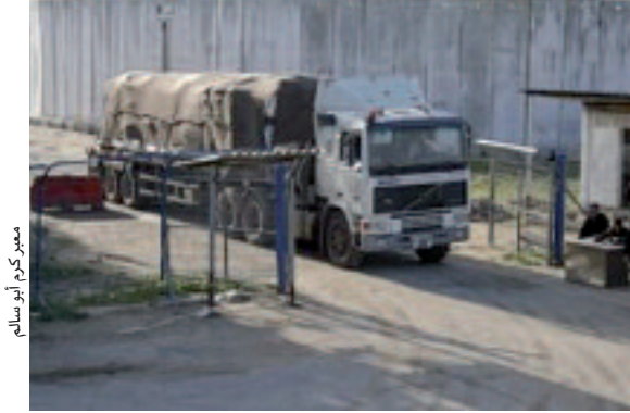
العمليات العسكرية في العراق