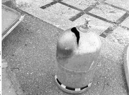
قارورة الغاز المتهالكة التي تسببت في حريق

وقد سجلت مصالح الحماية المدنية مؤخرا حريقا أصيب خلاله ثلاثة أشخاص بمدينة عين صالح، بحرق بليغة إثر تسرب الغاز من قارورة للغاز البوتان، حيث تسبب قدم الأنبوب الواصل للغاز في تسريته، وسط مطبخ ضيق وليس به فتحات للتهوية، وبعد محاولة تشغيل آلة الطبخ اشتعلت النيران فأصيبت الأم بحرق بليغة، بينما كانت أصابة الآخرين بسيطة، ولحسن الحظ كان التيار الكهربائي مقطوعا.