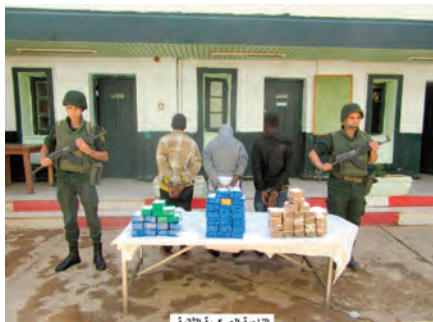
الطامة العسة 20

بالمخدرات بالجزائر، أوقفت مفارز مشتركة للجيش الوطني الشعبي، بالتنسيق مع مختلف مصالح الأمن خلال عمليات عبر النواحي العسكرية، 61 تاجر مخدرات وأحيقت محاولات إدخال 4 قنابل تقليدية 61 كيلوغراما من الكيف المماثل عبر الحدود مع المغرب، فيما تم ضبط 4,06 كيلوغرام من مادة الكوكايين و173405 قرص مهلوس. وتابع المصدر ذاته، أنه بكل من تمنراست وبرز باجي مختار وإن قزام، أوقفت مفارز للجيش الوطني الشعبي 131 شخص وضبطت 20 مركبة 68 مولدا كهربائيا و47 مطرقة ضغط، بالإضافة إلى كميات من خليط خام الذهب والحجارة والمتمفرجات ومعدات تفجير وتجهيزات تستعمل في عمليات التقيب غير المشروع عن الذهب، في حين تم توقيف 9 أشخاص آخرين وضبط بندقية نصف آلية و5 بنادق صيد و10846 لتر من الوقود و12 طن من المواد الغذائية الموجهة للتغذية والمضاربة و10 قنابل من مادة التيج، خلال عمليات متفرقة عبر الوطن. من جهة أخرى، تمكن حراس السواحل من إحباط محاولات هجرة غير شرعية بالسواحل الوطنية لـ 121 شخص كانوا على متن قوارب تقليدية الصنع، فيما تم توقيف 736 مهاجر غير شرعي من جنسيات مختلفة عبر التراب الوطني.