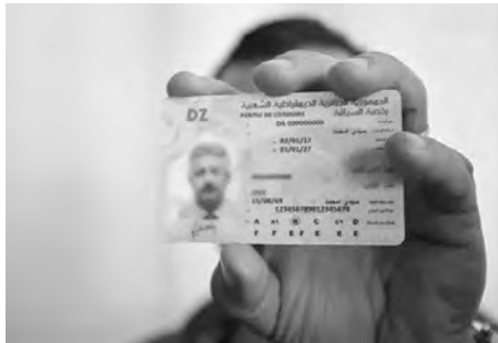
جميع بلديات الوطن بإصدار رخص السياقة البيومترية، وفق

دعت المنظمة الوطنية لأبناء الشهداء، أمس، بالجزائر العاصمة، رئيس الجمهورية، عبد المجيد تبون، إلى الترشح لعهدة جديدة في الانتخابات الرئاسية المقررة يوم 7 سبتمبر المقبل. وأكدت المنظمة في بيان لها عقب اختتام أشغال الدورة 45 لجلسها الوطني "دعماً الكمال لرئيس الجمهورية لاستكمال مسيرة الإصلاحات التي باشرها منذ توليه الحكم في ديسمبر 2019"، وأعلنت عن "ترشيحها الكبير لطلاب الأحزاب السياسية ومنظمات المجتمع المدني والمواطنين الداعية إلى ترشح الرئيس عبد المجيد تبون للانتخابات الرئاسية المقبلة" من أجل "استكمال بناء الجزائر الجديدة كما حلم بها الشهداء الأبرار".