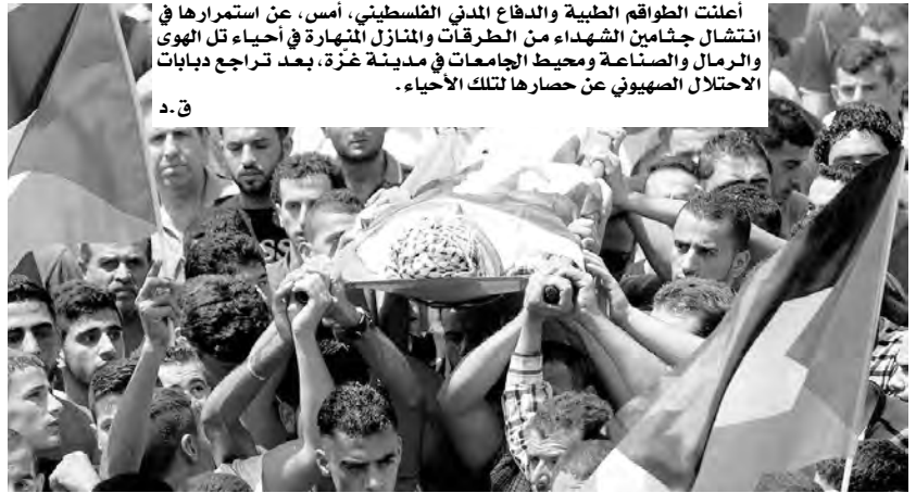
أعلنت الطواقم الطبية والدفاع المدني الفلسطيني، أمس، عن استمرائها في انتشار جثامين الشهداء من الطرقات والمنازل المنهارة في أحياء تل الهوى والرمال والصناعة ومحيط الجامعات في مدينة غزة، بعد تراجع دبابات الاحتلال الصهيوني عن حصارها لتلك الأحياء.