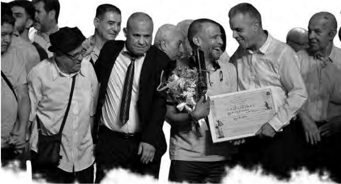
جانب من الاختتام