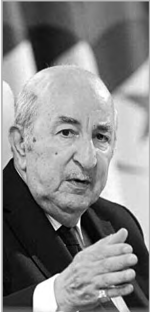
فعاليات المجتمع المدني ترحب بإعلانه الترشح للرئاسيات