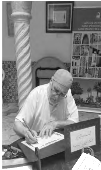
الأستاذ أن يكتب لها