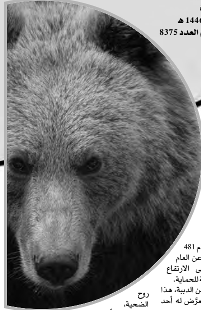
روح الضحية، البالغ 19 عاماً.

وافق برلمان رومانيا على إعدام 481 دب هذا العام، بارتفاع 220 دب عن العام الماضي، بهدف السيطرة على الارتفاع المفرط في أعداد الدببة الخاضعة للحماية. وأجاز أعضاءه قتل نحو 500 من الدببة، هذا العام، في أعقاب هجوم مميت تعرّض له أحد المتزهين، وأثار الغضب في البلاد.