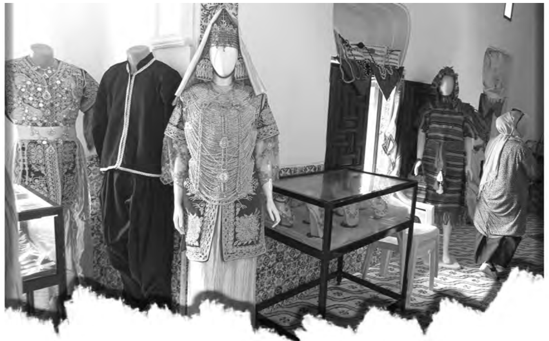
جانب من العرض