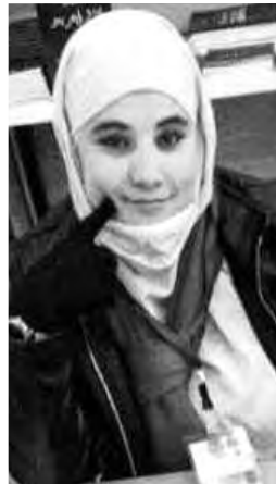
صدرت عن دار النشر "خطوة" التي تديرها خولة بوقرو.

• كلمة أخيرة؟ • أشكر جريدة "المساء" على هذا الدعم، كما أشكر كل من قال عن حلمي مستحيل؛ فقولهم جعلني أثبت لهم بالفعل، إن الله على كل شيء قدير.