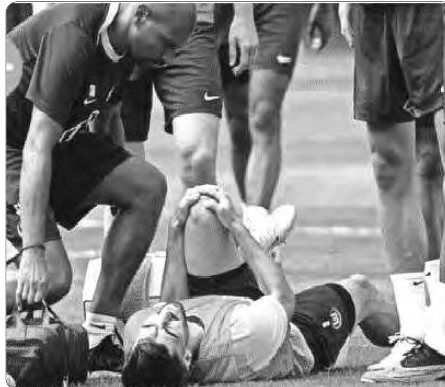
كأس بلجيكا 2024، حيث سجل 18 هدفا خلال 32 مباراة في الدوري البلجيكي الموسم الماضي.

أعلن فولفسبورغ، أول أمس، ابتعاد لاعبه الدولي الجزائري محمد الأمين عمورة عن التدريبات الجماعية، بسبب معاناته من الإصابة. وتوفيقي