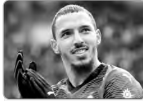
"برافو يا بطلّة، لقد أجبت في الحلبة، الجزائر كلها فخورة بك."