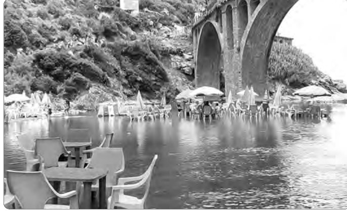
شساعة مساحة الجزائر وكبرها، تتعدّد العادات والتقاليد، وبذلك تختلف من منطقة لأخرى، واحترام تلك العادات عند التنقل أمر "واجب"، والحفاظ على المناطق التي تزورها "واجب" كذلك.