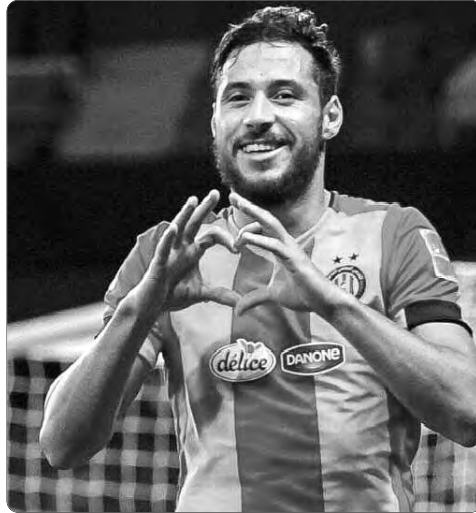
إلى ذلك، حرص نجم نادي بريست الفرنسي السابق بع نهاية المباراة على توجيه رسالة قوية لبيتكوفيتش، وقال في تصريحاته الإعلامية، رداً على سؤال بخصوص رغبته في العودة إلى "الخضر": "أنا دائماً جاهز لتلبية نداء"

الوطن في أي وقت، وتحمل هذه الكلمات رسالة قوية وواضحة للمدرب السويسري فلاديمير بيتكوفيتش، مفادها أن بلالي متحمس ومستعد للعودة، وتمثيل بلاده في الاستحقاقات المقبلة، وشدد يوسف بلالي بذلك، على عزمه القوي للعودة إلى صفوف "معاري الصحران"، بعد أن تم استعادته مجدداً عن قائمة بيتكوفيتش، استعداداً لمواجهة غينيا الاستوائية وليبيريا، شهر سبتمبر الحالي، ضمن تصفيات كأس أم إفريقيا 2025. ويُعتبر بلالي من أبرز اللاعبين الجزائريين الذين تألقوا على الساحة الدولية خلال السنوات الأخيرة، وعلى مدار مشواره مع المنتخب الجزائري، خاض بلالي 53 مباراة في جميع المسابقات، حيث أظهر أداءً مميزاً، ساهم بشكل كبير في تحقيق العديد من الإنجازات، أبرزها التتويج بكأس أم إفريقيا 2019، بمصر، كما سجل 9 أهداف، كان لها دور كبير في تحقيق نتائج إيجابية لـ"الخضر"، وبرز نجم الترجي التونسي أيضاً كصانع ألعاب من الطراز الرفيع، حيث قدم 25 تمريرة حاسمة لزملائه، مما يعكس دوره الكبير في بناء الهجمات وصناعة الفرص.