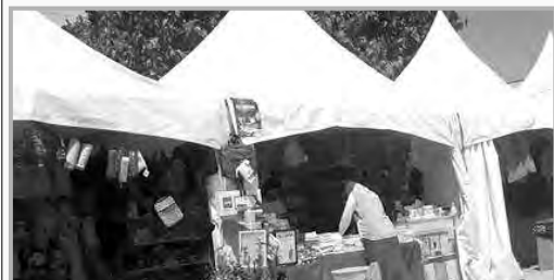
مدير التجارة قسنطينة: