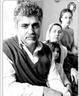
جامعة إسطنبول، ومن أبرز أعماله فيلم "براة" عام 1997، وفيلم "الصفحة الثالثة" عام 1999، وفيلم "مسير" عام 2001، وفيلم "قصر" عام 2006. وفاز بجائزة "المهر الأسوي الإفریقی" في مهرجان دبي السينمائي عام 2012. وجعلته أفلامه واحدا من أهم المخرجين في السينما التركية المعاصرة.