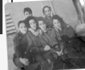
"هذا البحر لي" أفضل وثائقي

فاز فيلم "هذا البحر لي" من إنتاج تلفزيون سوريا، بجائزة أفضل فيلم وثائقي في مهرجان كوتكا لحقوق الإنسان 2024 الذي أقيم في فنلندا؛ ما يعد إنجازا كبيرا، خاصة أنها المشاركة الأولى للعمل في مهرجان دولي. ويتناول الفيلم قصة ستة ناجين سوريين حملوا في قلوبهم ذكرياتهم الأليمة، واضطروا لاتخاذ قرار الهجرة الصعب تحت وطأة حرب تدور رحاها في بلادهم، وتتطور الأحداث لتصل إلى اللحظات الفارقة في حياتهم، عندما لم يعد أمامهم سوى البحر ملاذاً أخيراً للهرب من الوحشية، والبحث عن حياة جديدة. وفي حين استطاع بعض السوريين الوصول إلى بر الأمل والأمان مع عائلاتهم، فقد آخروا أحياءهم في أعماق البحر خلال رحلة مخطوفة بالخطر والألم. ويتجسد في الفيلم الحنين إلى الوطن مع مشاعر الفقد والافتقار؛ إذ يتذكر الناجون شوارع الطفولة وحقائق الأحلام التي تركوها خلفهم. وقد ترسخت في ذاكرتهم صور الحرب التي لم تترك لهم خيارا سوى الهروب. يأخذ الفيلم مشاهديه في رحلة عبر أصوات هؤلاء الناجين، الذين يروون بصدق مشاعرهم المتضاربة بين الحزن والأمل، والفقد والحنين، الذين يروون بصدق تحديات لا يمكن تصورها. ويقدم فيلم "هذا البحر لي" للمشاهدين نظرة عميقة ومؤثرة لتجارب اللاجئين السوريين، مضيئة على قدرة الإنسان السوري على البقاء في مقاومة العنف واليأس. وجاءت مشاركة ضمن فعاليات مهرجان كوتكا؛ باعتباره احتفالا سنويا مخصصا للإضاءة على قضايا حقوق الإنسان من خلال السينما؛ إذ عرض المهرجان على مدار أربعة أيام، أفلاما تغطي مجموعة واسعة من الموضوعات الاجتماعية والسياسية، كالديمقراطية، والعدالة، والحرية، وحماية البيئة من مختلف أرجاء العالم. ومن المقرر أن يعرض الفيلم ضمن مجموعة من المهرجانات المتخصصة، قبل أن يتاح لاحقا للجمهور عبر الإنترنت.