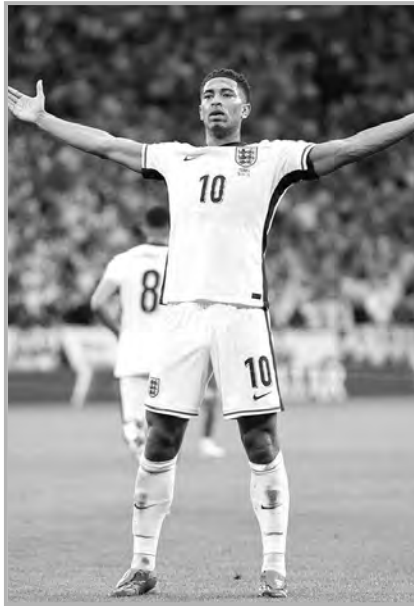
المرن، تحسين الأداء الرياضي.

وصُنعت هذه الجوارب من مادة السيليكون المضاد للانزلاق، وكذلك ذات تصميم سميك ومدمج، يساعد على امتصاص الصدمات والعزل، وامتصاص وتصريف العرق. ويمكن بفضل تصميم جزء مشط القدم