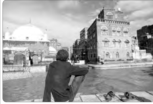
630 ميلادية، على قائمة التراث العالمي المعرض للخطر. وأوضحت المنظمة أنها اتخذت إجراء طارئا لإدراج هذه المواقع في قائمة التراث العالمي المعرض للخطر؛ بسبب تهديدات التدمير جراء الصراع المستمر. ويتيح الإدراج في هذه القائمة الحصول على مساعدة دولية معززة فنيا وماليا، وتساعد في حشد المجتمع الدولي بأكمله؛ لحماية المواقع.

وقدر مكتب صندوق الأمم المتحدة للسكان في اليمن ومسؤولون محليون، عدد الوفيات جراء الأمطار الغزيرة والسيول التي ضربت محافظة المحويت شمال غرب البلاد الثلاثاء، بنحو 40 وفاة، مع تضرر عشرات المنازل جزئيا وكليا، ونزوح المئات من السكان.