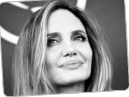
يشكل عرض فيلم "ماريا" الذي يتناول المرحلة الأخيرة من حياة المغنية ماري كالكاس، أحد أبرز محطات الدورة الجديدة

والتعاون لمرحان البندقية السينمائي؛ إذ يمثل هذا الفيلم مغامرة لأنجلينا جولي التي تصعد شخصية "صوت القرن"، وتولي إخراج العمل التشيلي بابلو لارين، الذي فاز خلال الدورة العاشرة من مهرجان البندقية، بجائزة أفضل سيناريو عن فيلم "آل كودني".