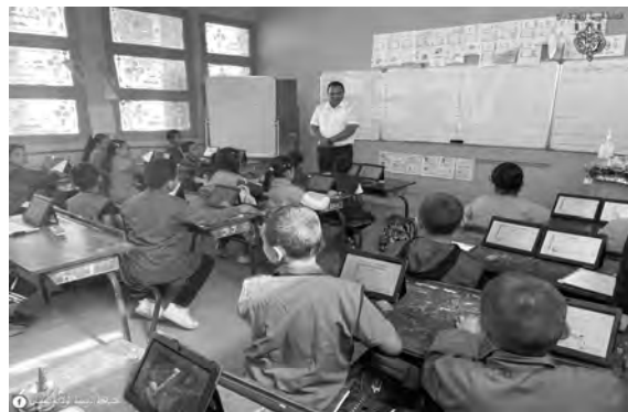
خلال هذا الموسم،

وأشار المتحدث إلى وجود مناطق ضغط أخرى، سيتم تخفيفها من خلال مشاريع موسم 2024-2025 على مستوى أولاد فايت، وجسر قسنطينة، وبئر خادم، وبئر توتة، التي يرمج بها مشروع إنجاز ثانوية، ومدرستين ابتدائيتين بالدورة وعين البنيان، ستسلمان