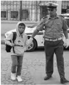
الاجتماع المدني يتطوع طلاء ممرات الرابطين

وفي إطار البرنامج الولائي للجمعية الوطنية للأمن والوقاية عبر الطرق، قام مكتب بلدية القل غرب سككدة، وبحضور المكتب الولائي والسلطات المحلية والشرطة، نهاية الأسبوع المنقضي وتحت شعار: "سلامتكم غابتنا معنا للحد من الحوادث"، بحملة تطوعية على مستوى مدينة شولوس، تمثلت في رسم تخطيطي لممرات الرابطين أمام كل المؤسسات التربوية، ومنه طلاء تلك الممرات من أجل سلامة التلاميذ، والمشاة بصفة عامة، بما يضمن حمايتهم من حوادث المرور، ناهيك عن تعريضهم بالقوانين المعمول بها: حفاظا على أرواحهم من مخاطر الطريق.