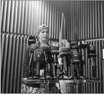
الورشة الوطنية الأولى حول تصنيف التراث الثقافي المادي