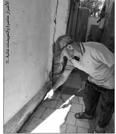
الأضرار حاصرة والتعويضات غائبة، 11.