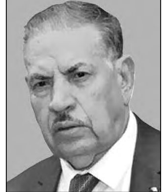
■ بقلم: المجاهد صالح قوجيل رئيس مجلس الأمة

وفي هذا الصدد، نؤكد أننا لن نتوقف أبداً عن الإشادة برئيس الجمهورية، السيد عبد المجيد تبون، الذي رسم 8 مايو من كل عام يوماً وطنياً لإحياء الذاكرة الوطنية وإحياء ذكرى مجازر 8 مايو 1945. وهذا ما يساهم بلا شك في الحفاظ على الذاكرة الوطنية، التي تشكل صمام الأمان لوحدة الوطنية... بالإضافة إلى ذلك، فإن الخيار السبيل الرامي للحفاظ على الذاكرة يهدف أيضاً لمد جسور التواصل بين جيل نوفمبر والأجيال الجديدة المكونة من نساء جزائريات ورجال جزائريين يطمحون إلى بناء جمهورية جديدة تصان فيها كرامة المواطنين، كما يسود فيها العدل والقانون... فهذا الولاء لثورتنا وتاريخنا بشكل عام لم يمنح البلاد من مباشرة تحول جذري يجسّد التغيير والتقدم نحو الجمهورية الجديدة.