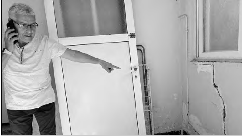
أحد أضرار جسيمة أصابت جدران وأرضيات المساكن