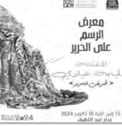
العمل ويبراعة في الإنجاز، والقدرة على رسم مساحات كبيرة وتقديم مشاهد

عاشت في هذه البيئة الصحراوية، كالزرافات وغيرها. وقد انبهر زوار المعرض بمجموعة الأوشحة والمناديل الكبيرة، وهي بمثابة تحف فريدة تبعث على الفرح والإعجاب، إذ تعكس رسومات هندسية ودلالات مستلهمة من الديكور الداخلي للبيئات الجزائرية القديمة في القصب وتلمسان وغيرها من المواقع التاريخية، زادت الزركشة وتداخل الألوان وتدفقها على سطح اللوحة الحريري تناغما وجمالا وأناقاة. وتتميز أعمال عيادي المنجزة على الحرير، بالتحكم الكبير في تقنية