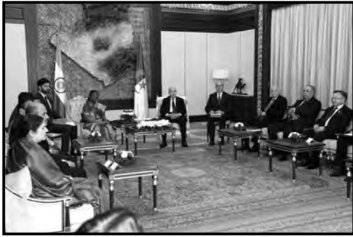
أشادت برؤية الرئيس تبون من أجل "جزائر جديدة" .. الرئيسة مرمو،

عازمون على رفع علاقاتنا إلى مستوى عال جدا ■ منتدى رجال الأعمال يسمح بتقييم مشاريعنا وإعادة تفعيل التعاون الاقتصادي ■ كفاحا المشترك ضد الاستعمار يلهم جهودنا لتحقيق الازدهار لشعبينا ■ تنويه بالتزام الرئيس تبون بترقية التعاون الثنائي ومتعدد الأطراف