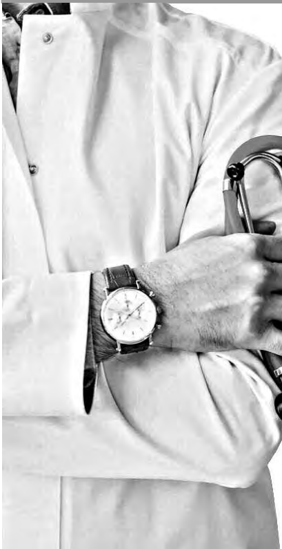
في إطار تعزيز البنى التحتية للصيدلية المركزية للمستشفيات

■ المتربصون يستفيدون من تعويض يومي بـ 500 دينار للوجبة ■ 2200 دينار تعويض التربص الميداني لطلبة الطب ■ محافظة المستلزمات البيداغوجية لطلبة طب الأسنان على عاتق المؤسسات الجامعية ■ استحداث 102 مركز لتطوير المقاولاتية بالجامعات