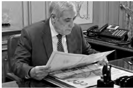
مرسوم رئاسي يحدد شروط وكيفية قبول الطلاب الأجانب في المؤسسات الجزائرية للتعليم والتكوين العائلي. وفي إطار متابعة تنفيذ توجيهات

وفي سياق التدابير الرامية إلى ترقية وتشجيع الاستثمار الخاص في مجال الصحة، درست الحكومة مشروع مرسوم تنفيذي يحدد ويتم المرسوم التنفيذي رقم 21-136 الذي يحدد شروط وكيفية استغلال المؤسسات الخاصة للصحة وسير وتنظيم نشاطاتها الصحية.