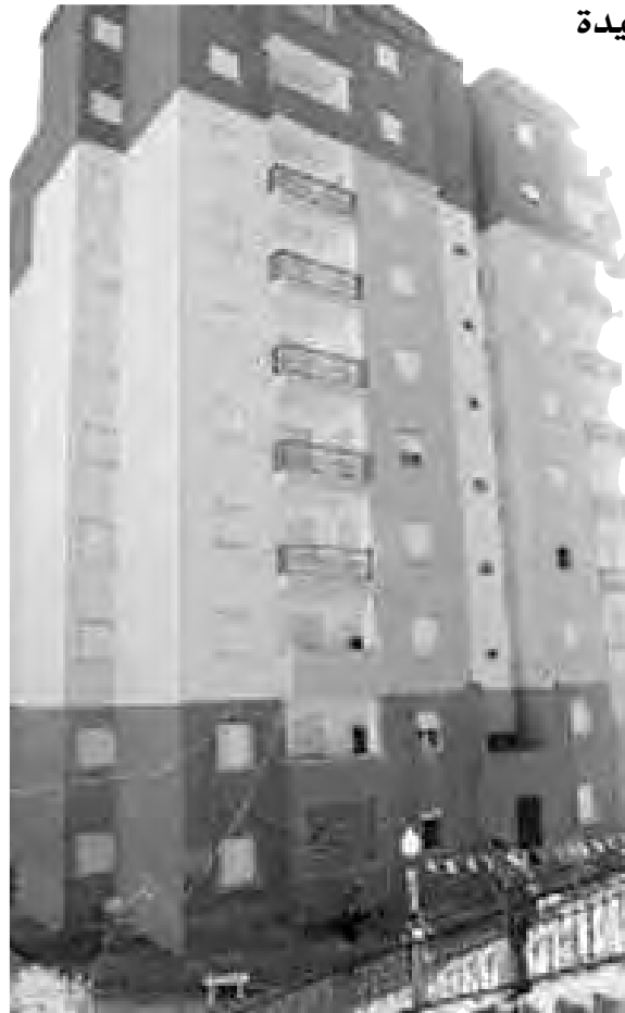
دراستها من جديد.

ودعا والي مقاطعة براقى المواطنين، الذين لم يسعفهم الحظ في هذه العملية، إلى التحلي بالصبر، إلى غاية الاستفادة من حصص جديدة مستقبلا، لاستكمال العملية.