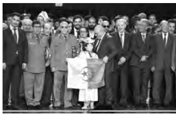
طلبة الثورة التحريرية.