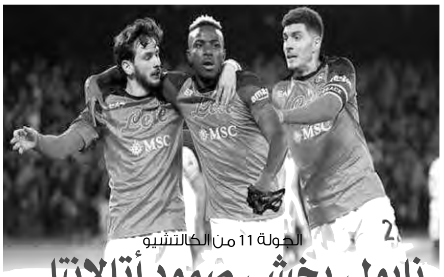
الكرة الذهبية 11 من الكالتشيو