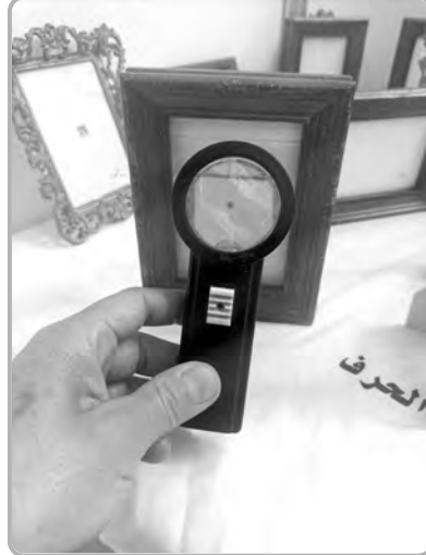
أصغر لوحة لامرأة جزائرية يرفع سقف التحدي. ترتدي "الحايك" الأبيض، جعله