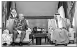
بحث الملف مع رئيس الحرس الوطني الكويتي.. الفرقي أول شقيقة؛

فقد جعل الرئيس، منذ عهده الأول من تلبية الانشغالات الاجتماعية للمواطنين، والتكيف مع الأوضاع الجديدة التي طرأت نتيجة التحولات الاقتصادية والاجتماعية، ضمن الواجبات الأساسية التي التزم بها تجاه الشعب، حيث كرس جهوده على تسيير برامج متنوعة لمختلف فئات وشرائح المجتمع بهدف تحقيق تطلعاتهم وضمان الرفاهية والعيش الكريم. في هذا الإطار سجلت الجزائر عدة مكسبات وبرامج اجتماعية لفائدة مختلف شرائح المجتمع، لاسيما العمال الشباب، المرأة الريفية والمالكة في البيت والأشخاص ذوي الهمم، بالرغم من تأثيرات الأزمة الصحية العالمية والتغيرات المناخية التي منّت اقتصاديات الدول، حيث واصل جهوده لتعزيز البعد الاجتماعي في السياسة العمومية تحقيقا للانصاف والعدالة الاجتماعية. وبالموازاة مع ذلك أولى الرئيس تبون، اهتماما كبيرا بتحقيق التنمية المحلية المستدامة في المناطق النائية من خلال تجسيد مشاريع فلك العزلة، النافذ بمهام الشرب، الكهرباء، الغاز، تحسين ظروف التمدرس والصحة الجوارية، فضلا عن رفع نسبة الربط بالمياه الصالحة للشرب إلى 98 بالمائة بفضل إنجاز عدة مشاريع تمس تحلية مياه البحر وتصفيته والمياه وبناء السدود.