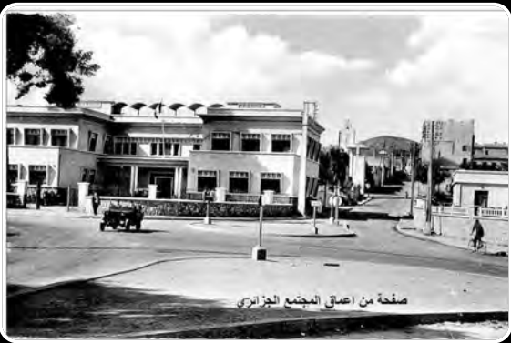
صفحة من اعقاب المجتمع الجزائري