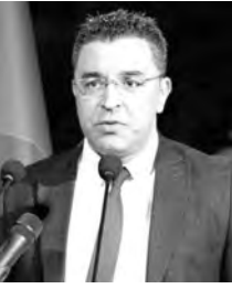
على الكتيّف، من أجل بناء مستقبل آمن بعيد عن الاضطرابات الجيوسياسية والتأثيرات الخارجية.