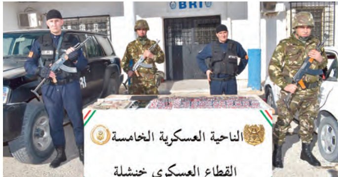
القطاع العسكري خنشلة

قنطار من مادة التبغ و29 طناً من المواد الغذائية الموجهة للتهريب مركبة و296 مولد كهربائي و212 مطرقة ضغط وأربعة أجهزة للكشف عن المعادن، بالإضافة إلى كميات من خام الذهب والحجارة والمتفجرات ومعدات تفجير وتجهيزات تستعمل في عمليات التنقيب غير المشروع عن الذهب.