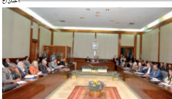
السياق الجزائري في المجال الفلاحي وحاجياتها المتنامية لاسيما في مجال الحبوب والحليب والتي تبقى تغطيتها رهيبة للاستيراد.

وأعرب ممثل شركة "إيرباس" للحوامات فابري ديليس، عن اهتمام الشركة البالغ لتطوير تعاونها مع الجزائر، مشيرا إلى أن الأخيرة تعد بلدا "رائعا" له مستقبل واعد ويمكك قدرات هامة في مجال الموارد البشرية، فضلا