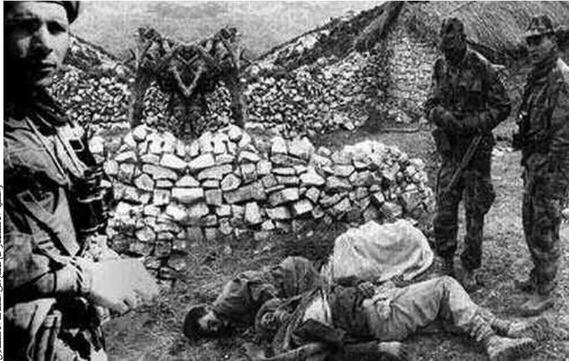
وحشية الاستعمار لم تنبع من اشتباكات الاستقلال

فيها المؤتمر، ومساهمة سكان المنطقة الكبيرة في إنجاحه وحماية المجاهدين والمنظمين من الاستعمار والجيش الفرنسي، مما جعله بكل نجاح كبير تم به إطلاق الكفاح المسلح الذي أجبر المستعمر على الانسحاب بالقوة واسترجاع السيادة الوطنية، بعد أن استشهد آلاف أبناء الشعب الذين قدموا الكثير من التضحيات من أجل أن تعيش الجزائر في حرية واستقرار، بعد المعارك الدامية التي احتضنتها عدة مناطق في بجاية، سواء الغربية منها أو الشرقية، كما كانت مجازر الثامن ماي 1945 القحطرة التي أفاضت الدماء، بعد أن استشهد عشرات المواطنين الجزائريين، فلما منهم بأن المستعمر الفرنسي سيلتزم بوعوده ويمنح الحرية، إلا أن ذلك لم يحصل، وتأكد الجميع أن الكفاح المسلح هو الوسيلة الوحيدة التي يمكن أن يتم بفضلها استرجاع السيادة الوطنية.