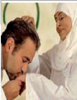
موجد: حتى لا تشتت الطفل وتضيع الجهود المبذولة من قبله في تقويمه وتربيته تربية إسلامية صحيحة.

أما القرود والذكور، فلا تحتاج إلى بلوغ النضج الجنسي بهذه السرعة مثل الإناث، إذ أن الحدود الوحيدة الموضوعية حول تواتر تكاثرها رهن بعدد الإناث التي يكتفها جذبا، ولكن لا يُعرف بعد لماذا لدى البشر تنتج الأمهات حليبيا مختلفا لأطفالهن وفقا لجنسهم، فثمة مؤشرات تظهر أن كل شيء مبرمج قبل ولادة الجنين. ولم يسجل الباحثون فروقا في محتوى البروتين والدهون في الحليب المنتج إذا وضعت البقرة أنثى أو ذكرا. وقد يساعد فهم الفروق بين حليب الأم البشري وتأثيره في نمو الطفل في تحسين حليب البودرة للأطفال الموجه إلى الأمهات المعازات عن الإرضاع.