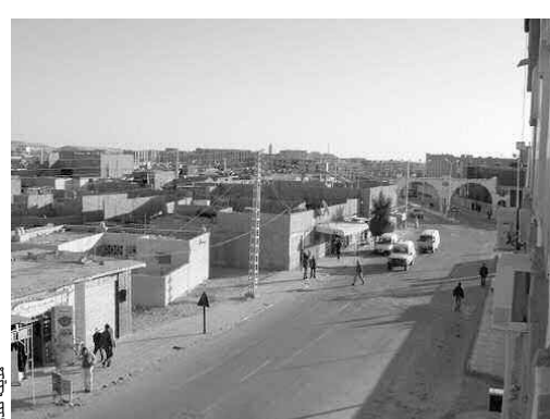
صورة جوية لمدينة بشار

المحلية. وباعتباره مركز لفضاء البرمجة، من الضروري دعم هذا القطب الجهوي بجهز متعدد الوظائف من أجل إعداد هيكلية أفضل لمجمل فضاء البرمجة. كما ستكون مدينة بشار المركز الاقتصادي الأكبر للجنوب الغربي للبلاد، في حين ستكون مدينتي تندوف وأدرار ذات أهمية اقتصادية قوية ومميزة، حسب توجهات مخطط تهئية فضاء البرمجة الإقليمية للجنوب الغربي وسيخصص