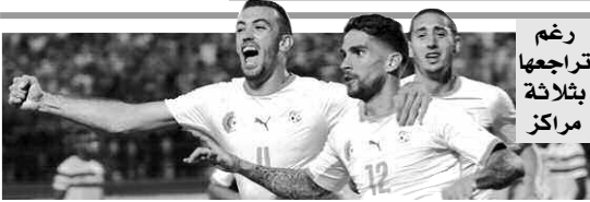
رغم تراجعه بثلاثة مراكز