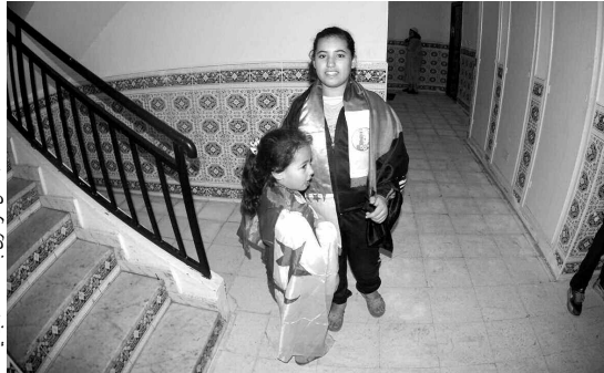
أطفال فرحون بالسكنات الجديدة

تهضم حق المقصين؛ كون أغلبهم مستفيدين من أراض وسكنات، وقاموا بتزيين الوثائق، وهو التفسير قدّمه والي العاصمة، منكرا بأن المعنيين لديهم الحق في الطعن، لكن يعجز مؤسسة.