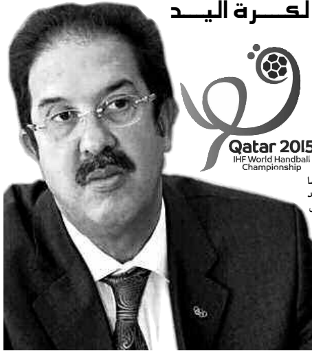
Qatar 2015 IHF World Handball Championship