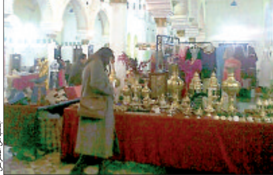
جانب من المعرض

تعرضها الطرقات، وتحديدا في الفترة المسائية، وبالتالي فإن تخصيص بعض البرامج الترفيهية للأطفال بمقر سكناهم، وهذه الطريقة يمكن مبادرة تستحق الشكر. وبهذه الطريقة يمكن للأطفال بلدية الأبيار الاستفادة من مختلف الأشغال التي تُعدها فيدرالية الحرف، وهو ذات الانطباع الذي لمسه لدى سيدة أخرى كانت تتفحص رفقة ابنتها الأحذية المصنوعة من الجلد، وترافق الشاب الذي كان يورشته يعمل، حديثا قائل: "مثل هذه الورشات تساعد كثيرا البالغين والأطفال على حد سواء، على الاطلاع على كفاءات تشكيل بعض الصناعات التقليدية، وتسهم في تثقيف الأطفال، وتعليمهم صورة واضحة عن موروثهم التقليدي. إن تخصيص مثل هذا