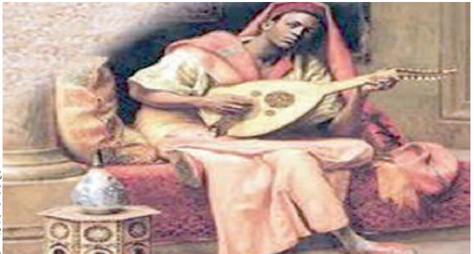
نموذج من زخارف الموسيقى بالأندلس