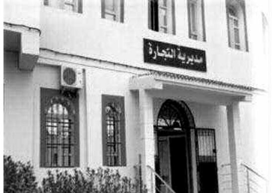
وقد تم تحويل تلك السلع المحجوزة نحو الميناء الجاف المتواجد بمنطقة السانيا، في انتظار استكمال الإجراءات القانونية قصد التخلص منها، حيث بلغت كمية المحجوزات بميناء وهران، 94 طنا، بقيمة مالية بلغت 22 مليار سنتيم، فيما قدرت على مستوى المطار الدولي أحمد بن بلة بالسانيا، بـ 3 أطنان من