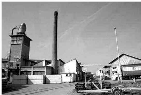
مناطق نشاطات طالما سمح العقار بمختلف البلديات، وهذا لخلق مناصب شغل وتقليص البطالة، حسب مدير التشغيل بالولاية.

كشف مدير التنمية والصناعة وترقية الاستثمار بولاية المدية السيد لطفي رزوق، أن عدد المشاريع الاستثمارية التي نالت الموافقة من قبل اللجنة الولائية للمساعدة على تحديد الموقع وضبط العقار وترقية الاستثمار، وصل حتى نهاية العام الجاري إلى 249 مشروع استثماري، بغلاف مالي إجمالي يصل إلى 122 مليار دينار جزائري، ما يمكن من خلق 28 ألف منصب شغل للشباب البطالين.