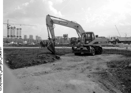
الأنشغال تتواصل بالصابلات

أوكلت مؤسسة النظافة بولاية الجزائر «إكسترا نات» مهام جديدة، تخص جمع النفايات الصلبة من بينها الرودم، وكذا أغصان وجذوع الأشجار والنفايات المتواجدة على شواطئ البحر، بعد أن كان عمل المؤسسة مقتصرًا على جمع ورفع النفايات المنزلية، حيث خصمت شاحنات وعمالا مؤهلين للعملية.