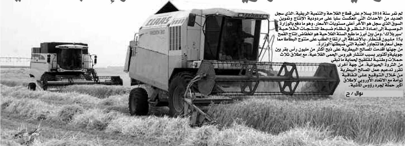
نوال / ح

لم تتر سنة 2014 بسلا على قطاع الفلاحة والتنمية الريفية، الذي سجل العديد من الأحداث التي انعكست سلبا على مردودية الإنتاج وتكوين السوق الذي سجل هو الآخر أعلى مستويات الأسعار، وهو ما دفع بالوزارة الوصية إلى إعادة النظر في نظام ضبط المشتريات الفلاحية "سير بلاك". ومن بين أبرز ما طبع السنة الفلاحية هو انخفاض إنتاج القمح 15.5 مليون قنطار، بالإضافة إلى ارتفاع الطلب على منتج البطاطا مما جعل أسعارها تتجاوز العتبة التي ضبطتها الوزارة. من جهتها أقدمت المصالح البيطرية على ذبح أكثر من مليون رأس بقر بين جويلية وأكتوبر بسبب انتشار فيروس الحمى القلاعية، مع إطلاق ثلاث حملات وطنية للتقصي لجماعة ما تبقى من الثروة الحيوانية، من جهة أخرى تقرر تدعيم عمل المصالح البيطرية من خلال التوزيع على الشفافية تواءمة مع الاتحاد الأوروبي لإطلاق أكبر حملة لجرد رؤوس الماشية.