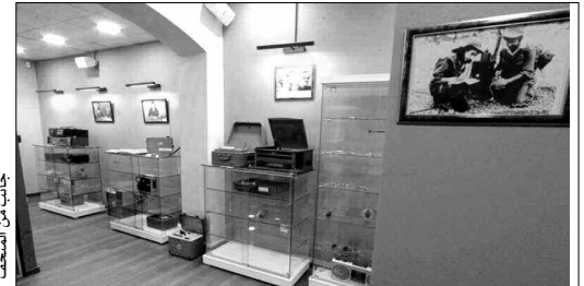
جانب من المتحف