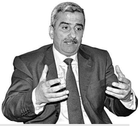
تحضيرا للتظاهرات الدولية التي تنظمها الجزائر شهري فيفري ومارس