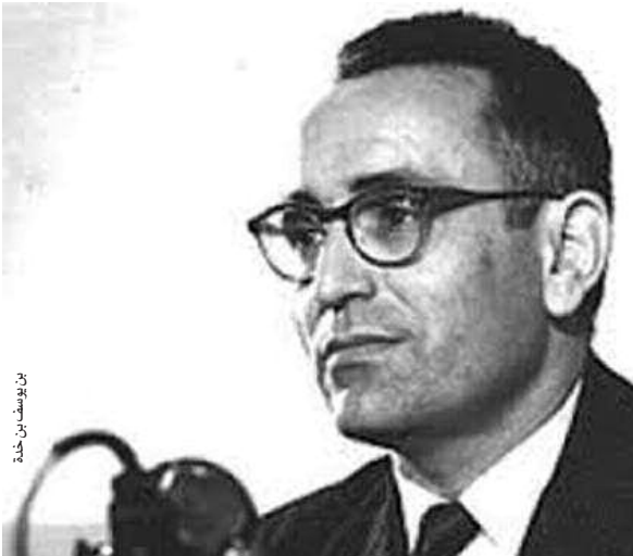
بن يوسف بن خدة

وتشمل محاور الملتقى المرجعيات والخلفيات في الفكر الثوري عند بن يوسف بن خدة ومواقفه وأدواره في الحركة الوطنية 1937-1954 وكذا مسؤولياته وإسهاماته في الثورة التحريرية، وبين يوسف بن خدة رئيسا للحكومة الجزائرية المؤقتة، وبين خدة مؤرخا من خلال إعطاء قراءة في كتاباته ومؤلفاته.