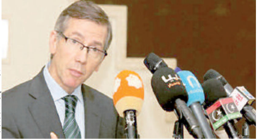
الجنرال الليبي إلى ليبيا

الليبي الأمل في جني ثمار ثورته أن يقتضوا أنهم أخطأوا في تحديد مفهوم هذه المصلحة التي يبدو أنهم حددوها وفق مصالح حزبية وإيديولوجية ضيقة، راح كل طرف يؤكد أنه على صواب ومن عاداهم مخطئون. وهو ما يفسر لجوءهم إلى تغليب لغة السلاح للدفاع عن تلك القناعات، وبقى عامة الشعب الليبي يدفع ثمن حرب عمياء بدأت تأتي على الأخضر واليابس.