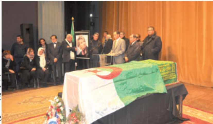
جانفي من التالين / ت. مصطفى