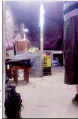
دكان قديم للحامص