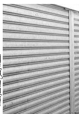
مغلقة، وطرح على يد سكان المنطقة

العاصمة، لكن بالمقابل يؤكد أحد الشباب لـ "المساء"، أن عملية التوزيع عرفت نوعا من التحايل والتلاعب من طرف المسؤولين، والغريب في الأمر أن هذه المحلات سلمت لأطباء ومحامين سيمارسون مهنتهم الإضافية بها، في الوقت الذي يحتاج شباب المنطقة لعمل يخلصهم من البطالة، فيما أكد لنا شاب آخر أن البلدية لا تملك سوكا جوارية، ومن المفروض أن تخصص هذه المحلات لبيع اللوازم الضرورية لسكان المنطقة؛ من خضر وفواكه وأغراض أخرى، لكن "تجري الرياح بما لا تشتهي السفن"، يضيف أحدهم، مؤكدا أن الشباب المقصين من هذا المشروع، لم يجدوا سوى مراسلة