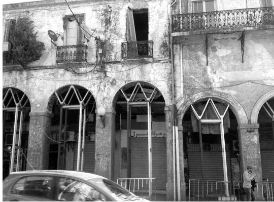
صورة للعمارات القديمة بمدينة سكيكدة

دقيق لحالة المباني ودرجة الاهتراء والكشف عن الطريقة التي بنيت بها هذه الأخيرة ومدى تقدم تدهور الأساسات والجدران. مع العلم أن ولاية سكيكدة استفادت من مبلغ مالي إجمالي يقدر بمليار ونصف مليار دينار خصص لإعادة تأهيل 3000 سكن قديم، ستتم أساسا سكنت الشارع الرئيسي "ديدوش مراد" والحي "النابوليتاني" وسكنت الأحياء القديمة الواقعة في "زقاق العرب" و"السوقية" والتي يعود أغلبها إلى الحقبة