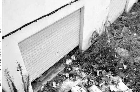
عندما تتحول "محلات الرئيس" إلى أكوام للنفايات