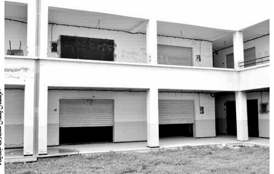
الإصالحات بيطال محلات جديدة