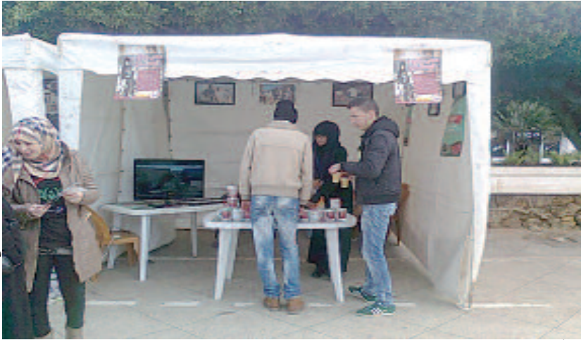
حملة التبرع لـ «دير الخير وأنساء».

راجعة إلى قلة الوعي، وضعف الحملات التحسيسية ولا كيف نفسر أن بعض الذين يأتون للتبرع لا يزالون يحتجون ببعض الأسباب الواحية لإقناع أنفسهم بعدم التبرع كالخوف من العدوى، أو لكون الأجهزة غير معقمة، لذا في اعتقادنا أننا بحاجة إلى مثل هذه الأنشطة الجوارية لتذكير عامة الناس بأن واجباً إنسانياً في انتظارهم..