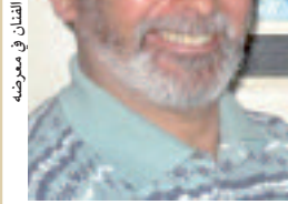
الفنان في معرضه

الذي غالبا ما يكون معيقا بالياسمين والزهو وياقات الورد، بينما في أسواق أخرى تظهر غلة الأرض واللحوم والأسماك وغيرها.. ويستطيع المشاهد أن يتذوق بعينه طعمها الطازج.