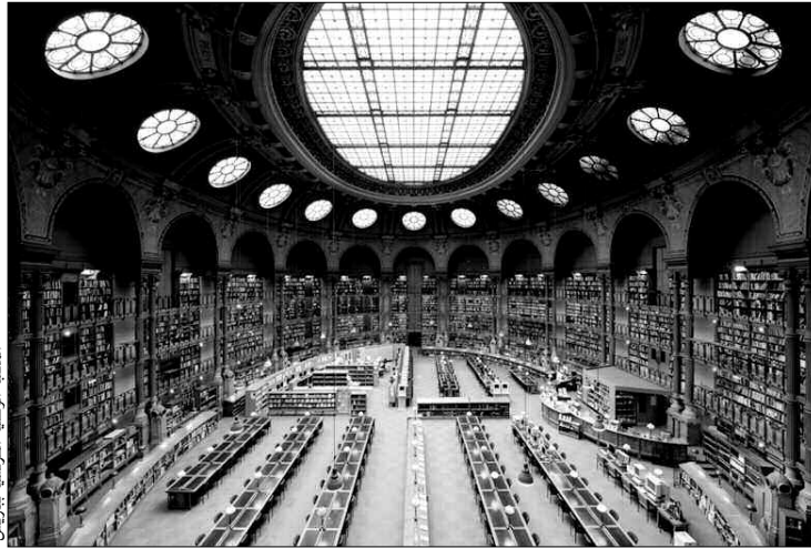
المكتبة الوطنية الفرنسية بباريس

فلم أسمع عن كاتب مسلم يتحدث عن "أسلمة الغرب"، ولو أن الدكتور مراد ويلفريد هوفمان الدبلوماسي المسلم الألماني يرى في كتابه كامل له، بأن "الإسلام هو البديل" للأنظمة السائدة في العالم حتى يسود العدل والمساواة، كما ورد ذلك في القرآن الكريم، إننا في الغرب نعيش جدلاً لا ينتهي من أناس بضاعتهم في الثقافة الإسلامية لا تكاد تذكر، ففرنسا اليوم بعد رحيل جهازة الاستشراق والمختصين في الحضارة العربية الإسلامية، خلا الجو لأناس بعيدين كل البعد عن الثقافة الإسلامية، فهم ديمagogيون ومغذون للفتنة الكبرى، ويبقى الإسلام ينتشر على نطاق واسع، رغم ما يزرعه الإعلام الغربي في طريقه من أفاع، ونحن من الشاهدين على ذلك، وعلى المسلمين مزيداً من الجهد والأخلاق الإسلامية حتى يجد الإسلام طريقه إلى ملايين الناس في الغرب، وما ذلك على الله ببعيد والله الموفق.